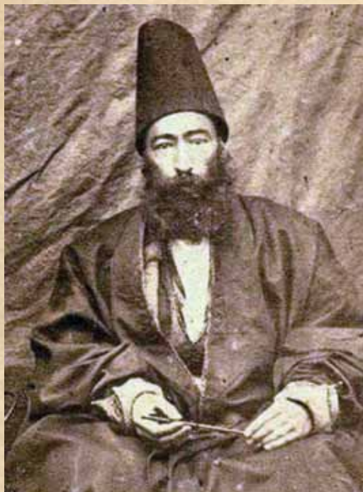
میرزا غلامرضا اصفهانی

درس هفتم بخش خوش‌نویسی کتاب سوم راهنمایی به شرح حال عمادالکتاب اختصاص یافته است. در مورد عمادالکتاب علاوه بر کتابت شاهنامه و سایر ارکان ادبی می‌توان گفت آغاز رسم‌المشق نویسی به شیوه امروزی به ابتکار او بوده است. جزوات رسم‌المشق وی مشتمل بر ۳۶ جلد است که او با زحمات زیاد آن‌ها را در هلند به چاپ رسانده است. او در کتیبه‌نویسی نیز دارای قدرت